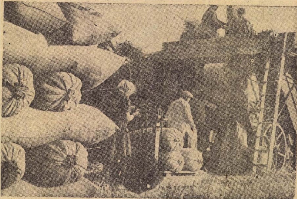
Bár a szövetkezeti gazdák nagy többsége idős ember, mégis fiatal fürgeséggel veszik ki részüket a nehéz munkából. A tempó, amellyel a cséplésben haladnak — a fiataloknak is dicsőségére válna. Ügyességük, szorgalmuk révén 180—190 mázsás ősziárpa is szádba kerül naponta

A szakmunkásképzés és a különböző tanfolyamok hatása megmutatkozik a termelésben is. Ez év első felében 3,5 százalékkal javult a cipők minősége. A gyár félévi előirányzatán kívül, még 2115 pár cipőt termelt. Exportra 100 000 pár cipő készült el. A második félévben csak hazai szükségletre termelnek, és a férfipipkón kívül, női cipőket is gyártanak és szállítanak a kereskedelemnek.